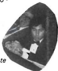
Figurita no quedaste fotogénico.