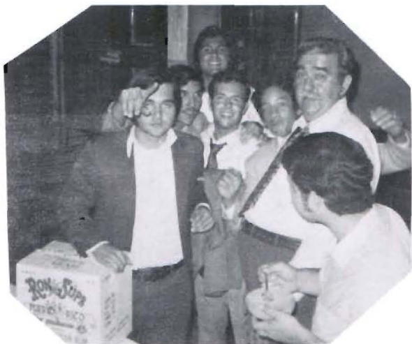
Domingo, nadie te va a robar el ron.