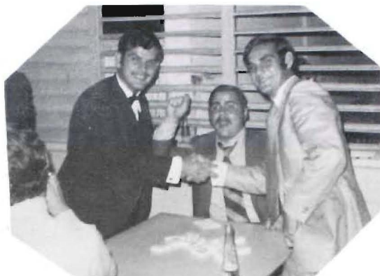
Franqui, no hubo trampa.