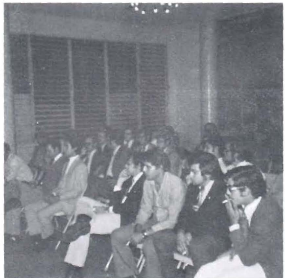
Asamblea reunida en la elección.