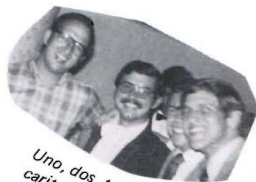
Uno, dos, tres, cuatro caritas alegres.