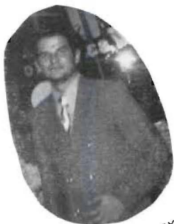
Un modelito sexy.