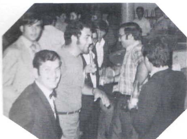
Bla, bla, bla...