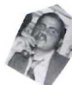
El biberón del nene.