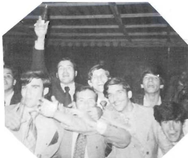
Muchachos, a la carga.